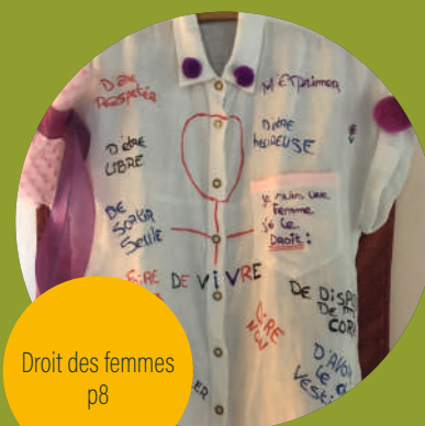
Droit des femmes p8