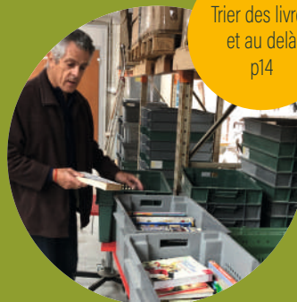
Trier des livres et au delà p14