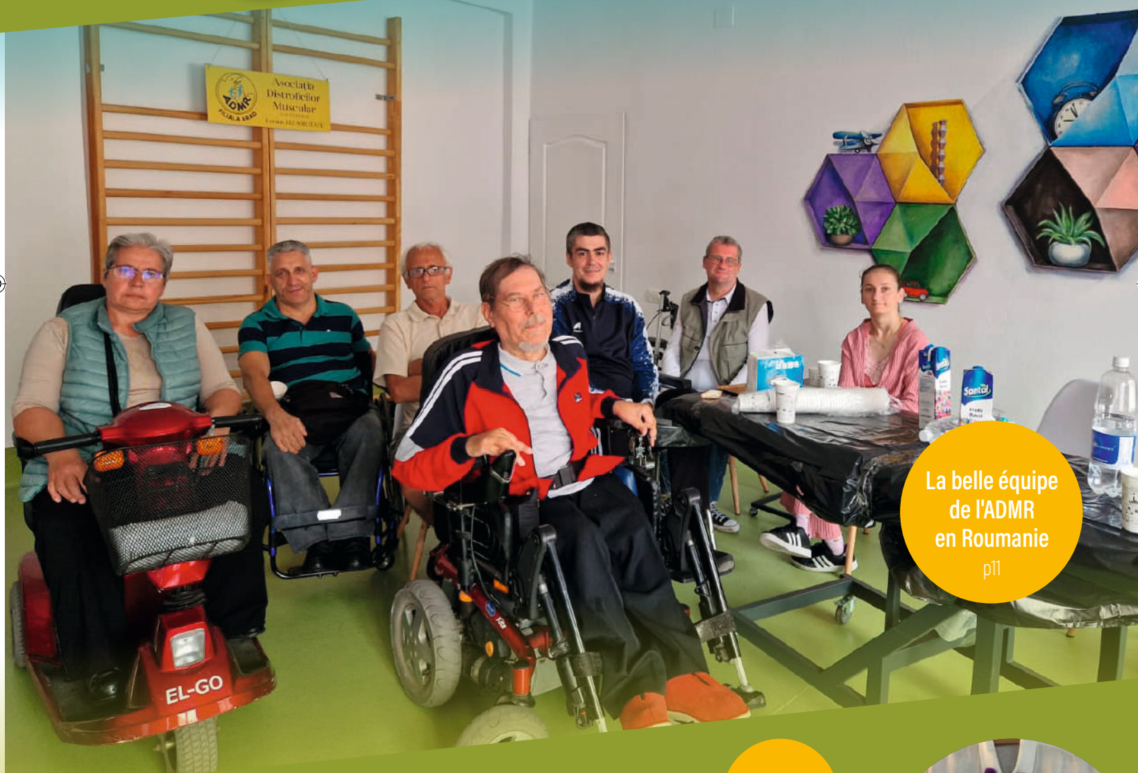
La belle équipe de l'ADMR en Roumanie p11

Bulletin d'information de l'association chrétienne de solidarité La Gerbe