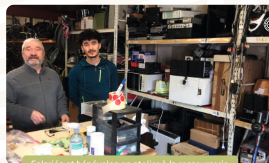
Salariés et bénévoles en atelier à la ressourcerie

organisation, renforcement, renouvellement des équipes, développement des partenariats.