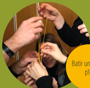
Batir un projet p16