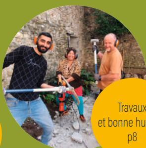
Travaux et bonne humeur p8