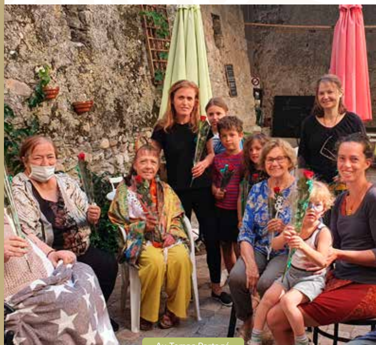
Au Temps Partagé