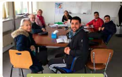
Cours de français langue étrangère

ont été vécus : à Ecquevilly avec la création d'un monte-charge permettant de donner une nouvelle vocation de stockage au rez-de-chaussée et de tri au 1er étage ; à Lézan avec la fin du chantier du Mas Latour , grâce à de nombreux bénévoles.