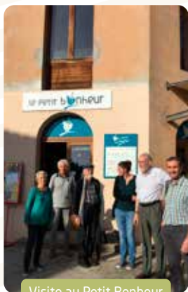
Visite au Petit Bonheur

Ce rapport retrace quelques moments qui ont sollicité nos engagements et valeurs associatives en 2022. Il vous vient certainement à l'esprit la tragédie vécue par des milliers d'enfants, de femmes et d'hommes ukrainiens, sans oublier aussi des familles russes. S'appuyant sur son histoire de partenariat avec des associations de solidarité en Ukraine et en Roumanie, La Gerbe a été fidèle à sa vocation dans l'action humanitaire et a mobilisé des forces sur ses deux pôles : expédition régulière de convois à partir d'Ecquevilly ; arrivée de familles de réfugiés, hébergement et accompagnement par des familles autour