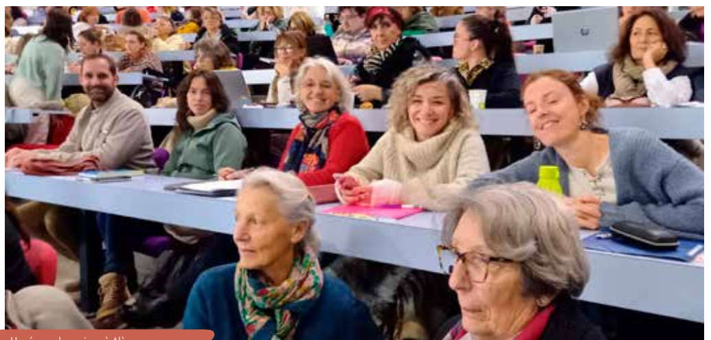
Un réseau dynamique à Alès.

À ce titre, La Gerbe a soutenu l'organisation du colloque