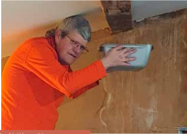
La solidarité face aux fuites.

Cet hiver, les pluies incessantes n'ont pas épargné la toiture de la Maison d'À Côté. Entre infiltrations et désagréments, le quotidien au troisième étage aurait pu virer à l'orage. Pourtant, là où l'agacement aurait pu l'emporter, les habitants ont choisi la patience et l'indulgence. Face à la complexité des travaux, l'ingéniosité a pris le relais : on installe des seaux, on