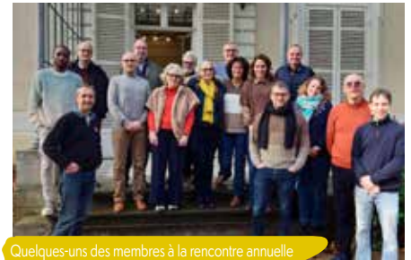
Quelques-uns des membres à la rencontre annuelle