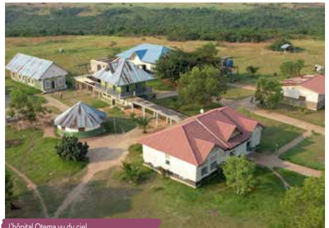
L'hôpital Otema vu du ciel.