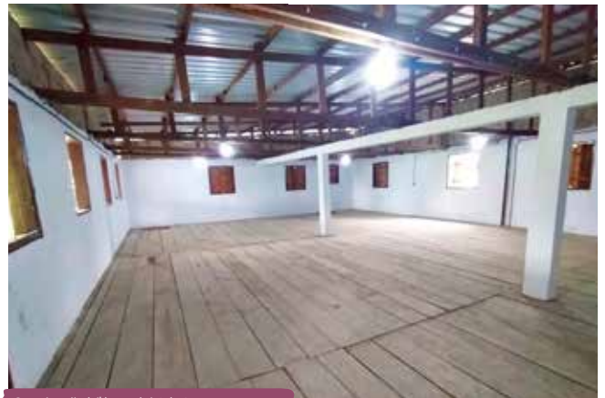
Grande salle à l'étage éclairée !