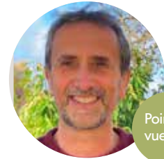
Point de vue de...

Avec ce premier numéro de 2026, notre revue franchit une nouvelle étape. Nouveau design, nouvelle maquette, mais une mission inchangée : rendre compte des actions portées par l'association La Gerbe, partager les joies, les réussites, les peines et les difficultés, comme elle le fait depuis son premier exemplaire en 1994. Pour souligner l'unité de l'association, les articles sont désormais rassemblés par rubriques (que nous vous laissons découvrir !) et non plus par lieu. N'hésitez pas à nous partager vos réactions ! Autre nouveauté : un thème par numéro. Pour lancer cette nouvelle mouture, quel meilleur thème choisir que celui qui est le titre de ce journal ? L'Espérance.