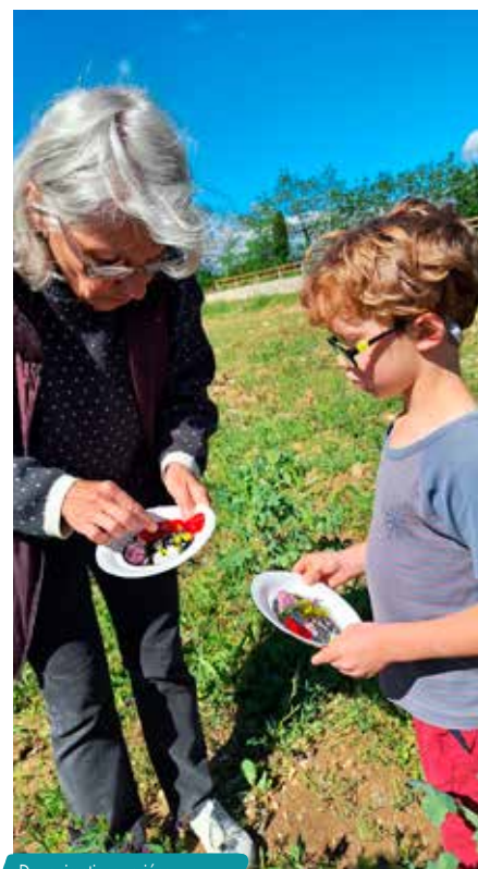
Des animations variées.