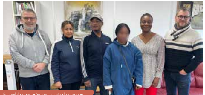
Ensemble pour préparer la suite de parcours.

simulations d'entretiens pour neuf participants. Cette intervention, très enrichissante pour nos salariés, leur a apporté des retours personnalisés pour apprendre à se situer dans cet exercice exigeant, avec confiance. Plusieurs points clés ont été relevés : connaître sa lettre de motivation, soigner sa posture et s'intéresser à l'entreprise, valoriser ses expériences, vérifier les contraintes du poste et apprendre à parler de soi de manière équilibrée.